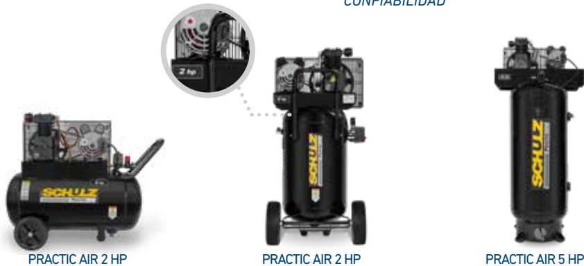
PRACTIC AIR 2 HP